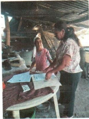
Entrega de ayuda económica a personas enfermas

Visita domiciliaria a las personas beneficiadas del aporte económico del adulto mayor.