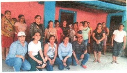
Visita a Tabacal